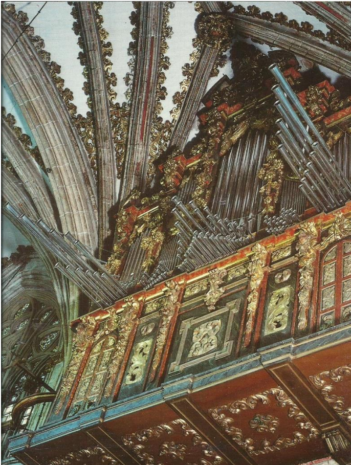
Fig. 1: Órgano monumental del Real Monasterio de Guadalupe.

SOLÍS RODRÍGUEZ, C. “Coro y órganos”, en la Catedral de Badajoz 1255-2005 en TEJADA VIZUETE, F. (Coord.) La Catedral de Badajoz 1255-2005 , Badajoz, 2007.