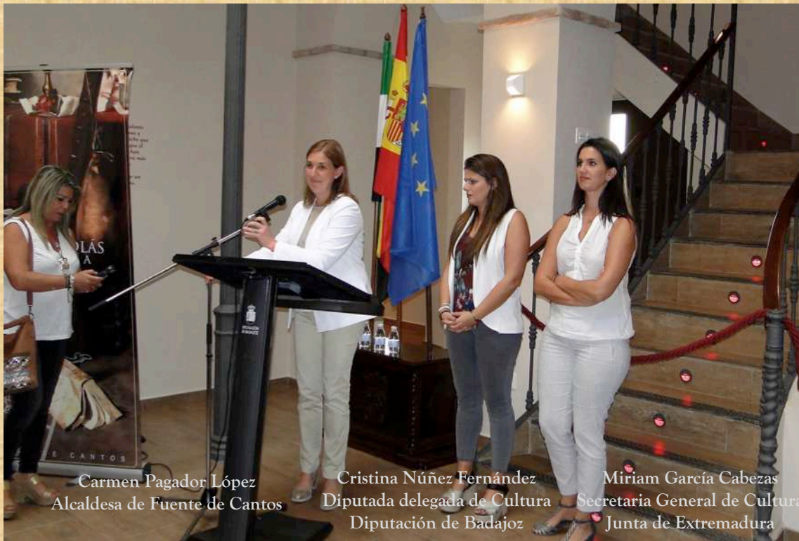
Carmen Pagador López Alcaldesa de Fuente de Cantos