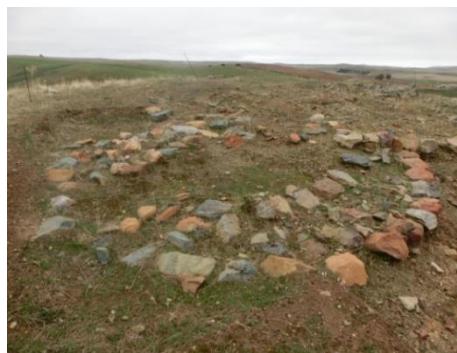
Fig. 1: Restos del poblado Castellijos I, yacimiento calcolítico de Fte. de Cantos

Hace más de 4.000 años, en el Calcolítico, nuestros antepasados vivían en habitáculos circulares de pequeñas dimensiones, contruidos con paredes de piedra seca o cogida con tierra y rematada con ramajes (figs. 1 y 2). Si nos trasladamos a nuestra época, a mediados del siglo XX, podemos ver, cómo con una pequeña evolución, aún vivían familias enteras en ese tipo de viviendas (fig. 3).