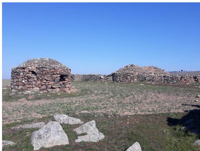
Fig. 3: Bujarda para el guarda (1) y bujardas para los animales (2)

En esta Comunicación sólo intento hacer un inventario de estas construcciones vernáculas que existen en nuestro término y he podido localizar,