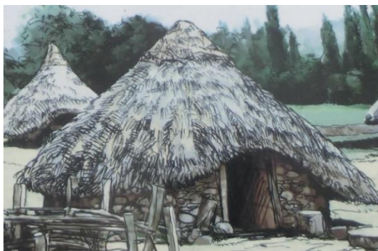
Fig. 2: Reconstrucción figurada de vivienda, según el panel interpretativo de Castellijos I