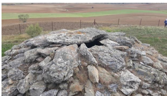
Fig. 5: Cierre de la bóveda.

Las bujardas se utilizaban como refugio del guarda en viñas y olivares, así como del porquero cuidador de cochinos. Las bujardas de porqueros, normalmente se construían junto a otras bujardas similares, de menor tamaño, que servían de zahúrdas para los cochinos y que se complementaban con un corral delantero.