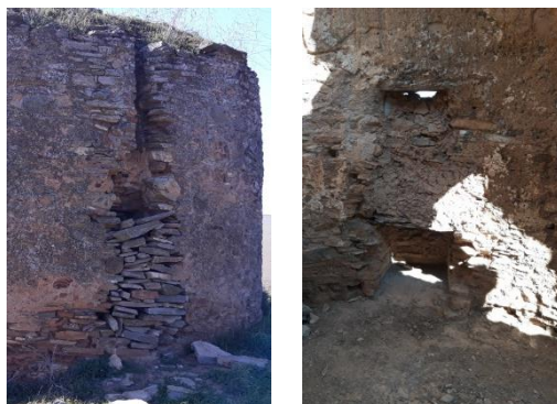
Imagen del exterior y detalles de la chimenea y del hogar