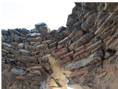
Fig. 4: Hiladas de la bóveda.

Este tipo de construcciones, con piedra seca, planta circular, escasos vanos y falsa bóveda, ya existía en la Prehistoria y también nos recuerda a los Castros Celtas. Están construidas con materiales primarios, aprovechando lo que se encontraba en el entorno. La técnica utilizada, mayoritariamente, es la de la piedra seca y falsa bóveda. Y como se puede comprobar unas están construidas con piedra seca y otras agregan argamasa de tierra. Son de forma circular, con diámetro que oscila entre los 3 y 4 m. No tienen cimentación y la pared, de unos 2 metros de altura, suele terminar en un voladizo, sobre el dintel de la puerta, en el que descansa una falsa bóveda construida con lanchas de piedra que avanzan un tercio en cada hilada, hasta cerrar la cumbre con una sola lancha, que queda suelta, para moverla cuando sea necesario y sirva de respiradero y salida de humos. Posteriormente esta cúpula se cubría con tierra o ramajes para su impermeabilización. Las hiladas de piedra van colocadas a matajunta, con un poco de inclinación hacia fuera y acuñaadas por dentro para evitar entrada de aire y quedar bien impermeabilizada.